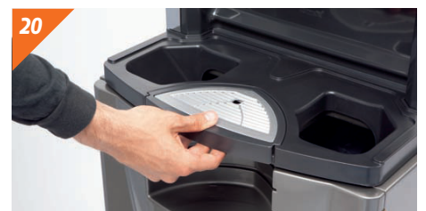
Remettre en place le plateau anti-goutte et son filtre.