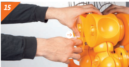
Insérer le couteau de nouveau: appuyer jusqu'à entendre le clic.