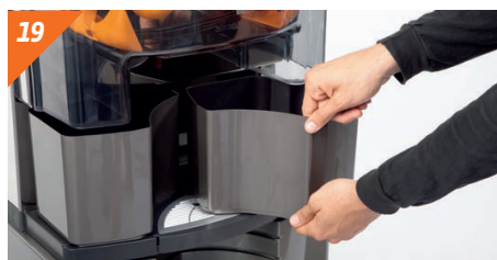
Remettre en place les bacs de récupération de peaux.