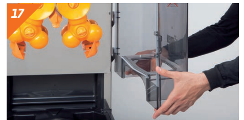
Remettre en place le capot.