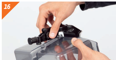
Remonter le robinet et son support.