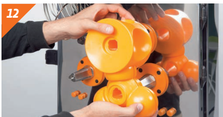
Remonter les tambours de pressage.

Pour assembler la machine répéter le processus dans le sens inverse et elle est prête à fonctionner.