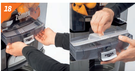
Remplacer le filtre et réservoir.